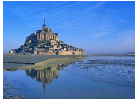
「モンサンミッシェル」イメージ

西洋の驚異と称されるモンサンミッシェルは、一度は訪れたいフランスの観光地人気No.1。 レンヌ駅を經由してモンサンミッシェルへ！パリからモンサンミッシェルまでの電車・路線バスのチケット、修道院入場チケットがセットになった、モンサンミッシェル観光に便利なチケットパックです。