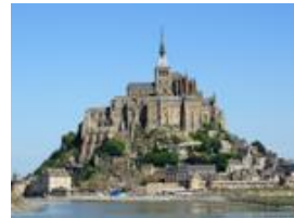
「モンサンミッシェル」イメージ