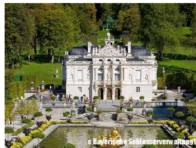
「リンダーホーフ城」イメージ

バイエルンアルプスの山々の中に立つルートヴィヒ2世による2つの夢の古城、ノイシュヴァンシュタイン城とリンダーホーフ城を訪れるツアーです。