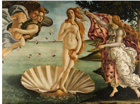
「ヴィーナスの誕生」イメージ