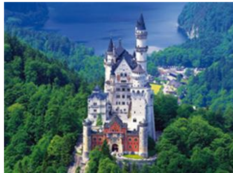
「ノイシュヴァンシュタイン城」イメージ